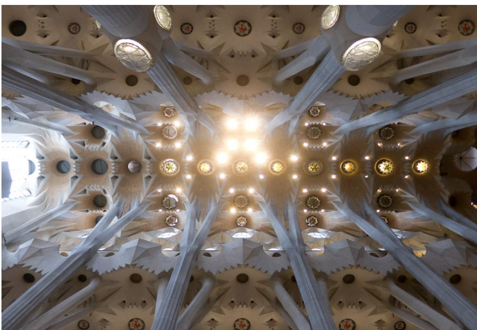
Zich vertakkende pilaren in Sagrada Familia