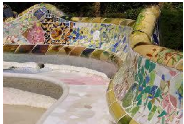
Deel van de Gaudi-bank uit Park Güell in Barcelona