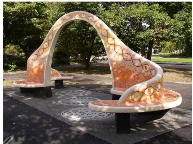
Bank uit PowerPoint presentatie Sfeerbeelden Park de Eendragt