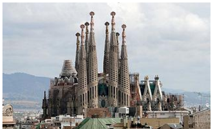
Sagrada Familia - Antoni Gaudi - Barcelona

Vorige week ben ik samen met mijn vrouw voor een paar dagen naar Barcelona geweest. Gewoon, even lekker er tussenuit. Er was daar één bezienswaardigheid waar ik beslist naartoe wilde, de Sagrada Familia. Dat is een basiliek ontworpen door Antoni Gaudi een architect die leefde en werkte in Spanje van 1852 tot 1926. Gaudi is zo iemand als waar ik het hierboven over had. Een man waar iedere architect stikjaloers op is. In 1882 werd er begonnen met de bouw van de Sagrada Familia en men is er nu nog steeds mee bezig. De vermoedelijke opleverdatum is 2026.